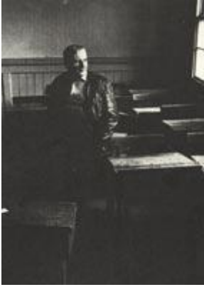
Рис. 187 Смысловая нагрузка окружающей обстановки

краю кадра, чтобы явственней ощущалась масштабность произведения скульптора. «Никкормат FT2», 24 мм, 1/30 с., диафрагма 11.