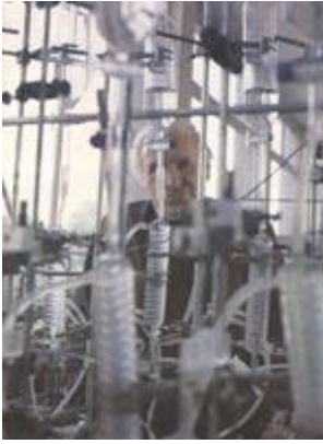
Рис. 179 Привычная окружающая обстановка

Стеклянные колбы и трубки засверкали ярче благодаря одной вольфрамо-галогенной лампе, установленной напротив модели. Снимок сделан на пленке для дневного света, поэтому на лампе — синий преобразующий светофильтр. «Пентакс» 6x7, 55 мм, 1/30 с., диафрагма 11.