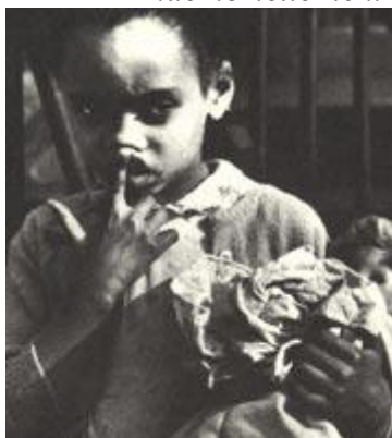
Рис. 174 Съемка на улице

Художник Фрэнк Ауэрбах жил и работал в комнате, где безраздельно царила живопись. Снимок воссоздает эту атмосферу. Художник здесь словно составная часть полотен. «Мамияфлекс С3», 65 мм, 1/30 с., диафрагма 11.