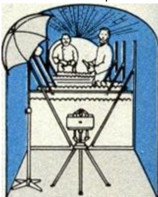
Рис. 168 Интересные для съемки места зачастую трудно освещать. Фотографируя двух рестораторов в винном погребе, я воспользовался вольфрамо-галогенной лампой (см. рис.), черные стены не отражали свет. «Пентакс» 6x7, 55 мм, 1/15 с., диафрагма 11.