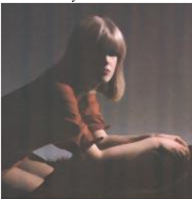
Рис. 191 Необычное освещение

Сочетание нежности и наивности я решил подчеркнуть с помощью позы, в которой есть нечто традиционно романтическое. Фон в классическом вкусе и шляпка с вуалью дополняют общее настроение. "Пентакс" 6x7, 105 мм, 1/15 с., диафрагма 16.