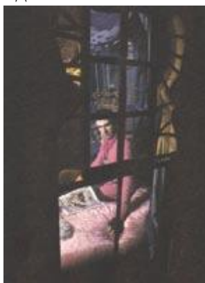
Рис. 177 Изображение «стиля» жизни

Определив средства для выражения основной черты образа, можно дополнить его отдельными красками и штрихами, которые составят как бы второй план, не отвлекая внимание от главной идеи.