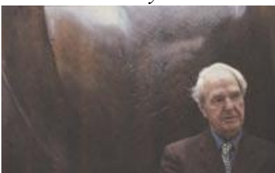
Рис. 186 Трактовка образа с помощью композиции

Дирижер Бернард Хайтинг сфотографирован в тщательно составленном обрамлении из музыкальных инструментов. Все элементы здесь подобраны не только по графической выразительности, но и по заложенному в них символическому смыслу. «Пентакс» 6x7, 55 мм, 1/15 с., диафрагма 16.