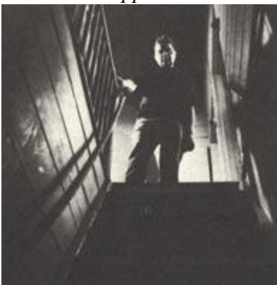
Рис. 181 Передача мироощущения

Здесь я представил мольберт в виде креста, и совместил с фигурой Фрэнсиса Бэкона, подразумевая мученическую природу его творчества. «Никкормат FT2», 65 мм, 1/60 с., диафрагма 11.