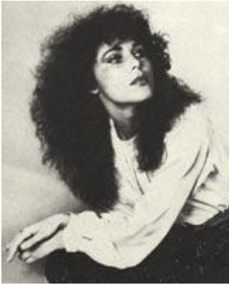
Рис. 189 У девушки, изображенной на снимках, наиболее привлекательны волосы и глаза. Обе позы подчеркивают это. Важную роль играет и направление взгляда. Я применил прибор заливающего света с рассеивателем в качестве основного источника и отражатель для подсветки теней. Задний план освещен прибором заливающего света, а на волосы направлен прожектор с рассеивателем. Освещение при съемке таких фотографий должно быть мягким. Усилить контрастность черно-белого снимка можно за счет недодержки с последующим увеличением времени проявления. "Пентакс" 6x7, 105 мм, 1/60 с., диафрагма 16, недодержка - одно деление.