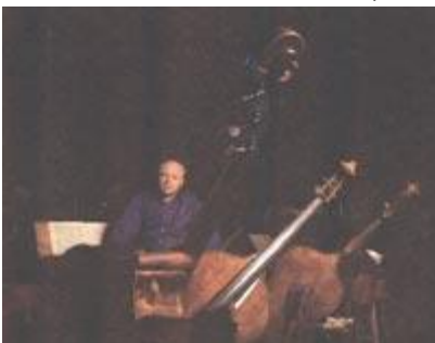
Рис. 185 Предметы-символы

Широкоугольные объективы позволяют включать в кадр окружающую обстановку, что вносит в изображение интимную ноту. С их помощью можно также исказить пропорции, как, например, вышло со странной парой башмаков на этой фотографии. «Пентакс» 6x7, 55 мм, 1/60 с., диафрагма 16.