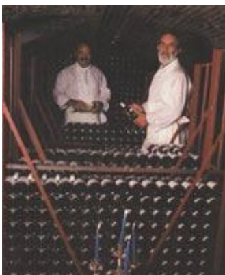
Рис. 167 Освещение места съемки

Важнейшая задача журнальной фотографии — привлечь и задержать внимание читателя. В данном случае я использовал оригинальную позу, а в качестве композиционного приема — зрительное сходство между скульптурой и моделью. «Пентакс» 6x7, 55 мм, 1/30 с., диафрагма 16.