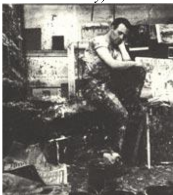
Рис. 175 Интересная окружающая обстановка

Хилтона. Когда я делал этот снимок в его крошечном домике в Корнуолле, он был уже очень слаб. Писал лишь небольшие картинки гуашью, а нередко лист бумаги так и оставался чистым. Я фотографировал при естественном освещении (см. рис. внизу). «Пентакс» 6х7, 55 мм, 1/60 с., диафрагма 11.