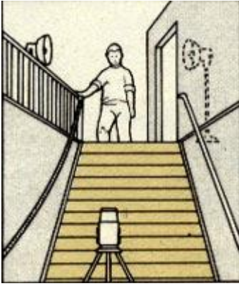
Рис. 182 Я попросил Фрэнсиса Бэкона встать на верхнюю ступень лестницы, чтобы возникло впечатление обособленности. Его фигура словно нависает над зрителем. Осветительные приборы расставлены так, чтобы придать художнику мрачный вид. «Мамияфлекс С3», 65 мм, 1/60 с., диафрагма 11.