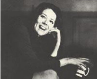
Рис. 173 Съемка по заданию