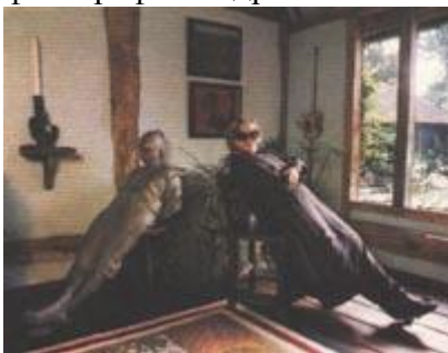
Рис. 169 Необычная поза

журналах, которые печатаются на дорогой бумаге, удастся сохранить нюансы тональных переходов в черно-белых иллюстрациях. Следовательно, снимки должны быть простыми по композиции, контрастными и очень резкими. Лучше всего делать отпечатки чуть контрастнее, иначе при воспроизведении они могут оказаться слишком мягкими по рисунку и серыми по тону. Среди цветных снимков полиграфисты выбирают насыщенные изображения, поэтому экспозицию необходимо знать точно. Непременно постарайтесь представить редактору снимок в нескольких форматах, горизонтальных и вертикальных, так как ему может понадобиться иллюстрация определенного размера, чтобы заполнить свободное пространство. Очень часто фотографии подрезают или кадрируют, поэтому при печати оставляйте со всех сторон «запас».