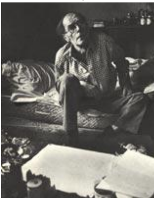
Рис. 172 Люди в горе