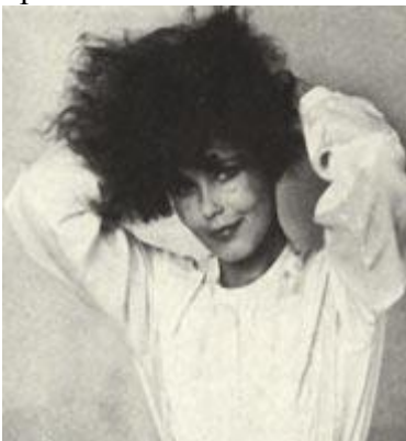
Рис. 188 Классические позы

При съемке таких портретов крайне важную роль играет освещение. Яркое контрастное освещение лишь в очень редких случаях дает хороший результат. Как правило, следует применять «голливудскую» схему. Тщательно продумайте позу: линии тела должны быть плавными и изящными, без острых углов и уродливых форм. Особое внимание необходимо уделить шее, плечам, груди и рукам. Никакого рецепта для романтического или «обаятельного» портрета не существует — к каждому объекту нужен свой подход. Но стоит забыть об индивидуальности модели и начать подгонять ее под шаблон «обаяния» — получится банальная красотка.