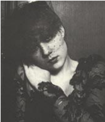
Рис. 190 Романтическое обаяние

Сочетание нежности и наивности я решил подчеркнуть с помощью позы, в которой есть нечто традиционно романтическое. Фон в классическом вкусе и шляпка с вуалью дополняют общее настроение. "Пентакс" 6x7, 105 мм, 1/15 с., диафрагма 16.