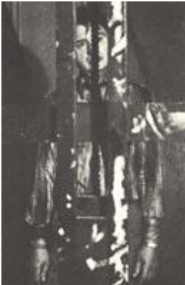
Рис. 180 Реквизит

Стеклянные колбы и трубки засверкали ярче благодаря одной вольфрамо-галогенной лампе, установленной напротив модели. Снимок сделан на пленке для дневного света, поэтому на лампе — синий преобразующий светофильтр. «Пентакс» 6x7, 55 мм, 1/30 с., диафрагма 11.